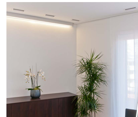
Das HomeVent® System bietet eine große Auswahl an stylischen Designgittern für die Zu- und Abluft. Fragen Sie nach dem Prospekt „HomeVent® Designgitter“.

Wir bieten Langlebigkeit, 15 Jahre Ersatzteilgarantie und professionellen Kundenservice rund um die Uhr.