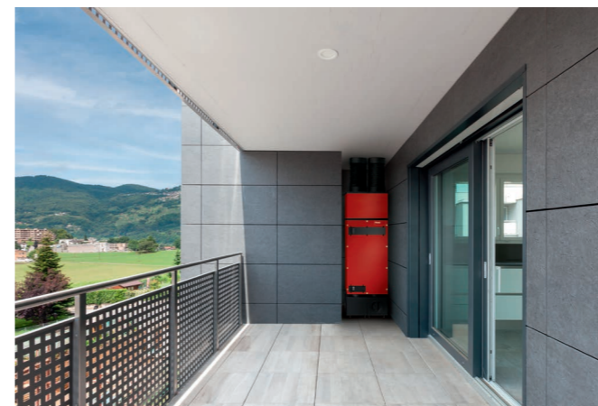
Die HomeVent® Komfortlüftungsgeräte lassen sich flexibel einbauen, so z. B. auch im Außenbereich auf dem Balkon.

Ob stehend, liegend, hängend, schräg oder quer. Im Innen- oder Aussenbereich. Kompakt im Schrank oder unter einer Treppe. HomeVent® passt sich flexibel der Umgebung an und integriert sich unauffällig in Ihr Heim. Selbst dort, wo die Anforderungen komplex sind.