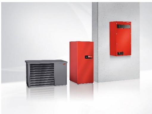
Wärmepumpe Hoval Belaria® pro mit Komfortlüftungsgerät HomeVent® ER